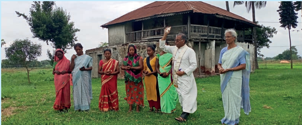
La benedizione del terreno sul quale si costruirà

COSTRUZIONE DI UN DISPENSARIO E SERVIZI SOCIO-SANITARI PER “CENTRO OSPEDALIERO JESU ASHRAM” - WEST BENGAL - INDIA